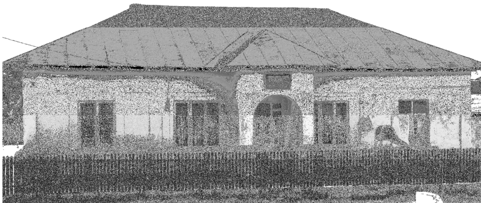
Localul vechi al Primăriei Leordeni, astăzi Grădiniță.

Celor care nu respectau prețurile afișate la primărie li se întocmeau procese-verbale de contravenție și un exemplar era trimis la judecătoria pentru a li se aplica legea. De exemplu, la 18 septembrie 1940, primarul comunei, la controlul făcut la moara Georgescu, a întocmit proces-verbal de contravenție, fiindcă se încasau șapte lei la dublu-decalitru, în loc de șase.