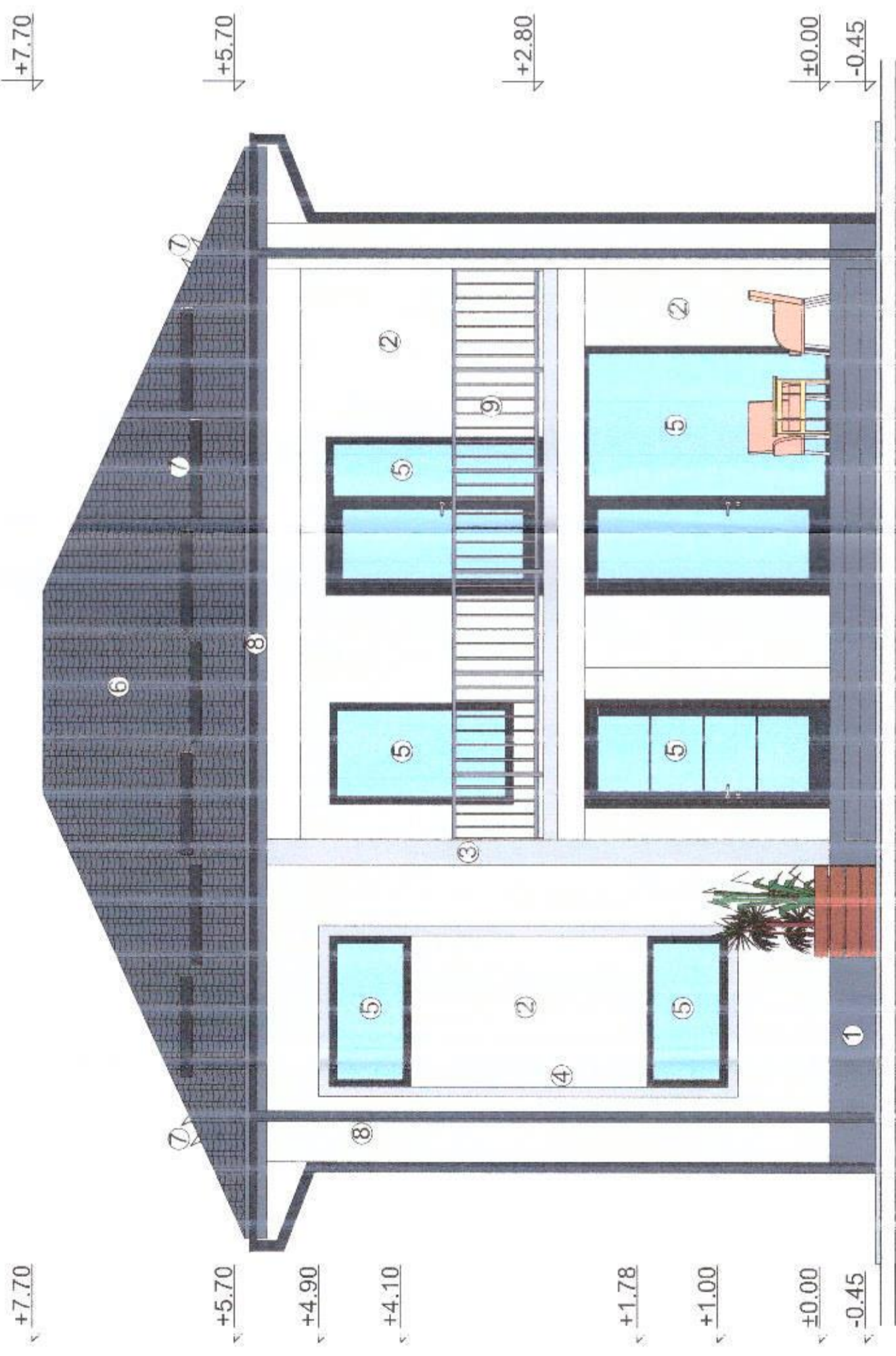
FATADA PRINCIPALA scara 1:50