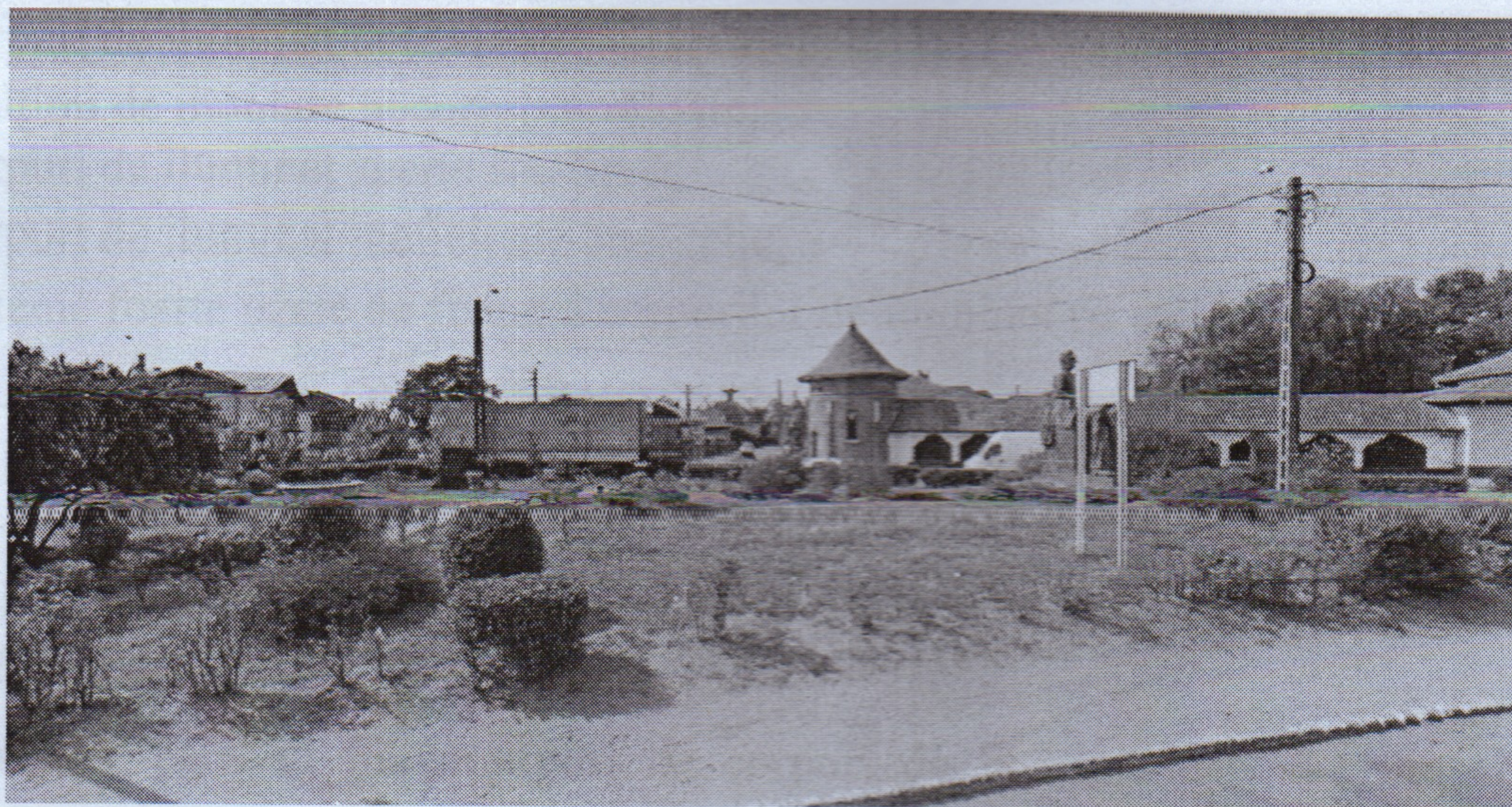
imaginea nr. 2.3.- 36 – Parc Public nr. 3: corpuri de iluminat lipsă (vedere din Drum Național ND 7)

Referitor la corpurile de iluminat , starea acestora este identică cu a celor din amplasamentul DN 7 respectiv Dj 702, fiind într-o stare avansată de degradare datorită aparatelor de iluminat și a surselor de lumină, dar și ineficiente din punct de vedere energetic.